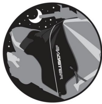
RETROREFLÉCHISSANT Retro reflecting. Reflektierende. Reflescante. Retro riflettente.