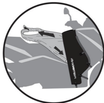
MODE ÉTÉ Summer version Winter Ausführung Versión verano Versione estate