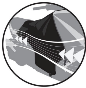
RIGIDIFICATEUR AÉRODYNAMIQUE Aerodynamic strengthener. Aerodynamischer und steiferer Teil. Estabilizadores aerodinámicos. Rigidificatore aerodinamico.