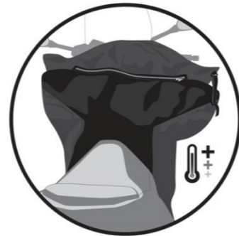
POLAIRE MATELASSÉE. Padded fleece. Gepolsterter Fleece. Polar alcohado. Pile trapunto.