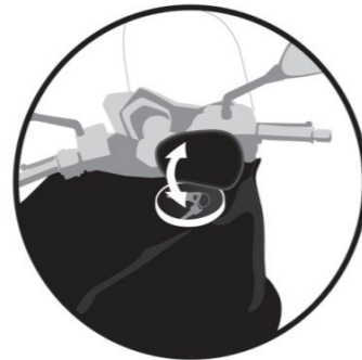
TRAPPE Trap door. Klappe. Tapa. Chiusura.