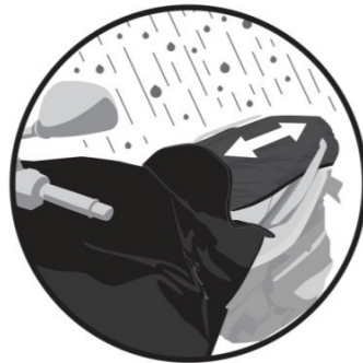
COUVRE-SELLE RÉGLABLE Adjustable cover for seat. Verstellbarer Sitzbanküberzug. Funda de asiento regulable. Coprisedella regolabile.