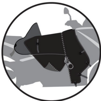
DÉZIPPABLE The two parts are separable with the zip Diese 2 Teile sind durch den Reissverschluss trennbar Cremallera para separar las dos partes Separazione delle due parte per un zip