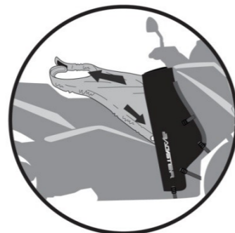
MODE ÉTÉ Summer version Winter Ausführung Versión verano Versione estate