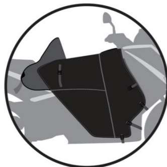
MODE HIVER Winter version Sommer Ausführung Versión invierno Versione inverno