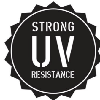
HAUTE RÉSIDENCE AUX UV ET AUX INTEMPÉRIES 6 selon norme NF EN ISO 105 - B02 & B04 Strong UV and bad weather resistance. Hohe UV- und Wetterbeständigkeit. Altamente resistente a los UV y a las inclemencias climáticas. Alta resistenza agli UV ed intemperie.