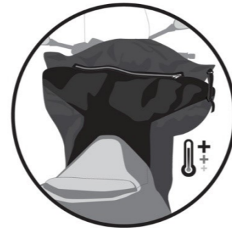
POLAIRE MATELASSÉE. Padded fleece. Gepolsterter Fleece. Polar alcohado. Pile trapunto.