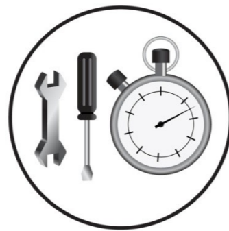
MONTAGE SIMPLE ET RAPIDE Quick fitting. Schnelle Montage. Montaje rápido. Montaggio rapido.