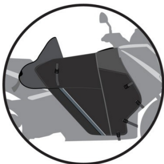
PROTECTION ET MAINTIEN DU TABLIER Gives protection and holds the apron in place Schutz und Bewahrung der Beindecke Protección y porte del delantal Protezione e mantenimento del coprigambe