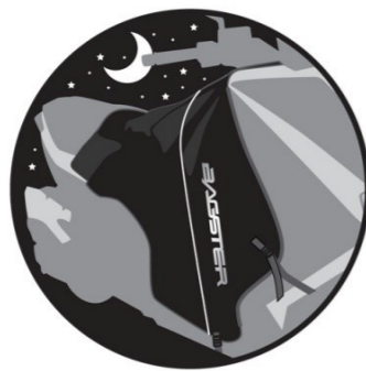
RETROREFLÉCHISSANT Retro reflecting. Reflektierende. Reflescante. Retro riflettente.