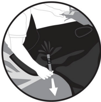
SANGLE D'AJUSTEMENT. Adjustable strap. Befestigungsgurt. Cinghia di adeguamento. Cinghia di adeguamento.