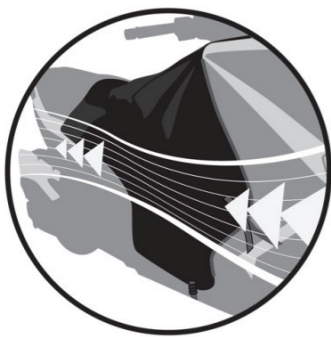
RIGIDIFICATEUR AÉRODYNAMIQUE Aerodynamic strengthener. Aerodynamischer und steiferer Teil. Estabilizadores aerodinámicos. Rigidificatore aerodinamico.